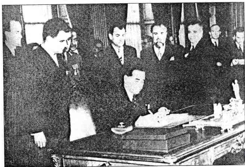
Gheorghe Tătărescu, ministru de Externe al României, semnând Tratatul de Pace. Paris, 10 februarie 1947